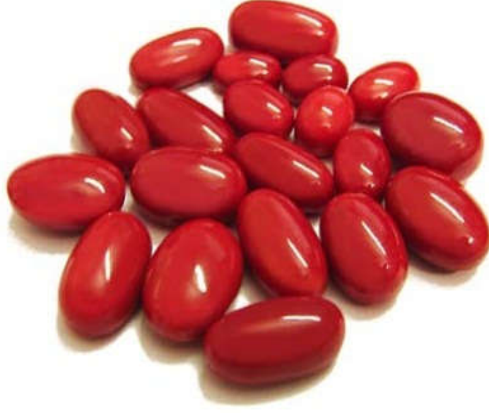
Red Coral பவழம்